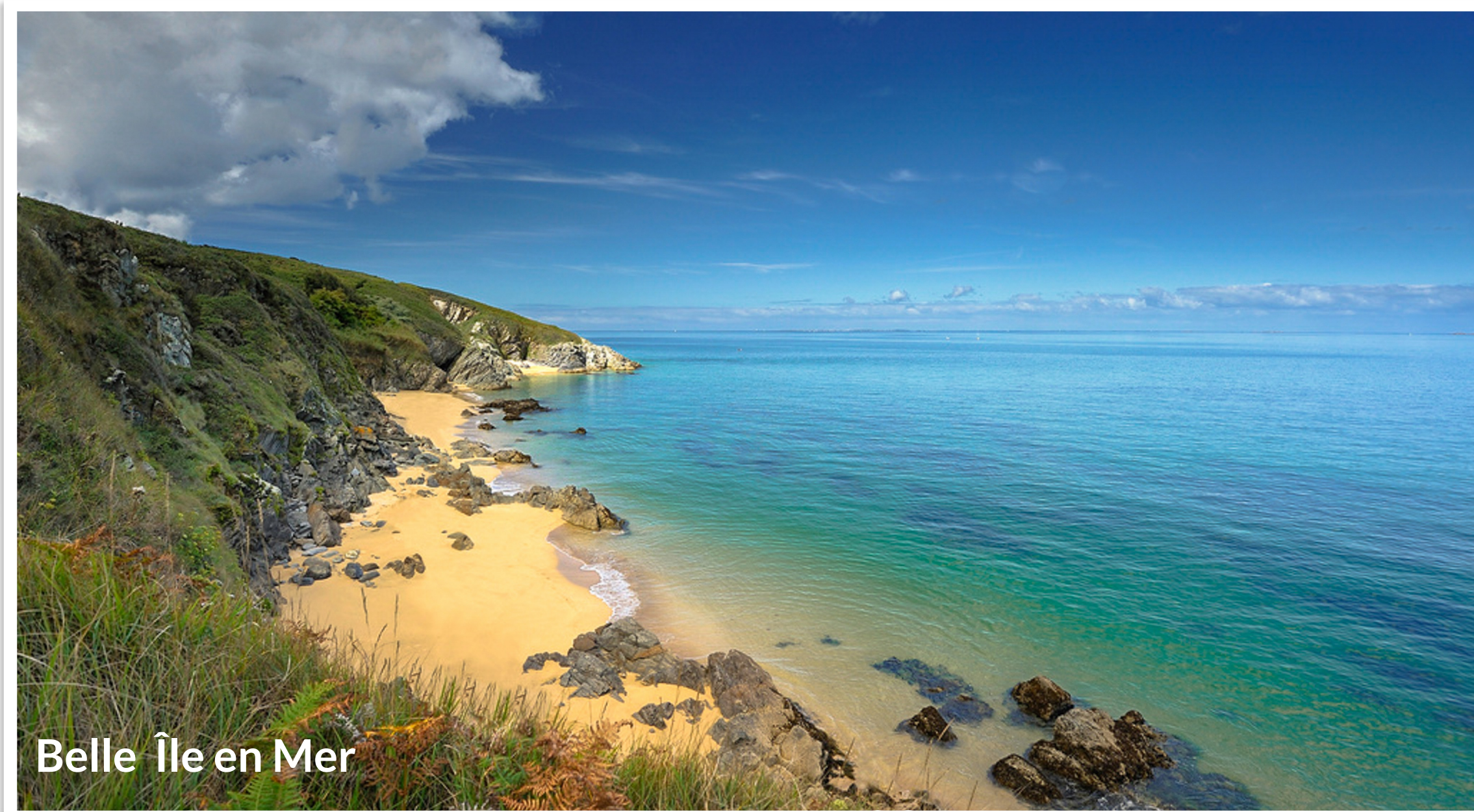
Belle Île en Mer